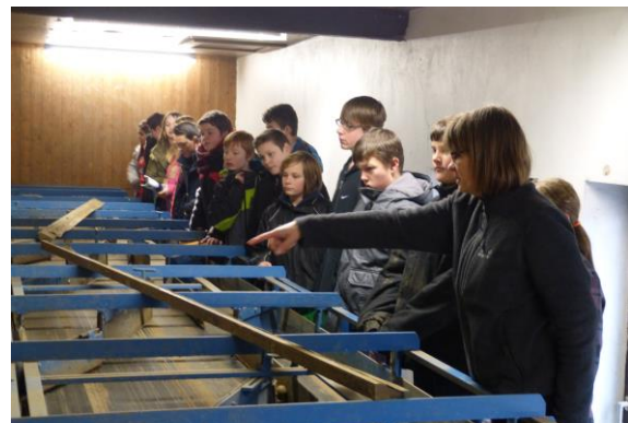
Mit dem 7SW-Kurs unterwegs in der Firma

Als Firma haben wir mehrere Gründe für eine Kooperation mit der Realschule. Zum einen möchten wir bei den Schülern und auch deren Familien für die „Kartoffel“ werben.